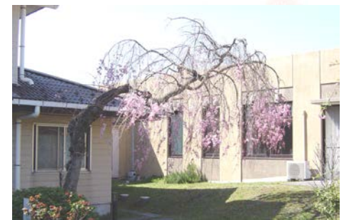
病院中庭 仙台しだれ桜