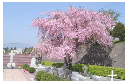
墓地 仙台しだれ桜

時代と共に建物が多く建ち、桜の樹も少なくなっています。ピンクや白色、八重桜が咲く庭を楽しまれてはいかがですか。ちなみに、晩翠と八枝の間には、男女 6 人の子どもがいましたが、そのうちの 5 人までが 20 歳代で病死しています。八枝はその試練をキリスト教に入信し、キリスト教の教えに従って生きた人です。夫の晩翠を残して 1948 年 5 月 10 日に 69 歳で人生を終えています。