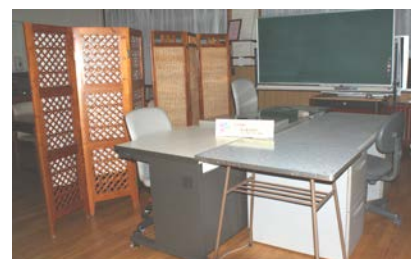
ステーション事務所 こちらを着々と準備が進んでいます