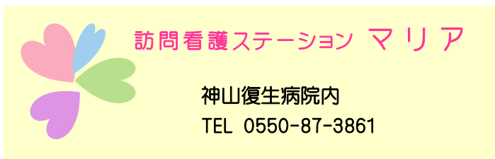
訪問看護ロゴマーク

4月から新規事業として、訪問看護ステーションマリアが開設されます。もろもろの準備と並行して、マリアの家・ホスピスのスタッフと近隣地区の老人会の皆様への説明会をさせていただいています。説明をしていく中で、「この地区の方々が安心して暮らせるようなサービスを提供したい」という想いが、どんどん強くなってきているのを感じています。「住み慣れた我が家で暮らしたい」という想いを支えて行けるよう、お一人お一人を大切にしたいケアを、心をこめて提供していきたいと思っています。